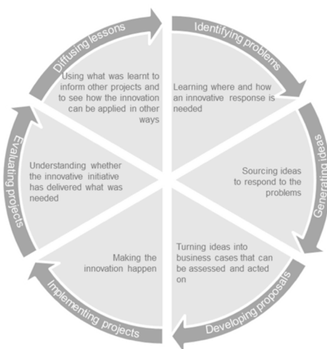
Ciclo di vita dell'innovazione 1

Questa impostazione metodologica consentirà di: